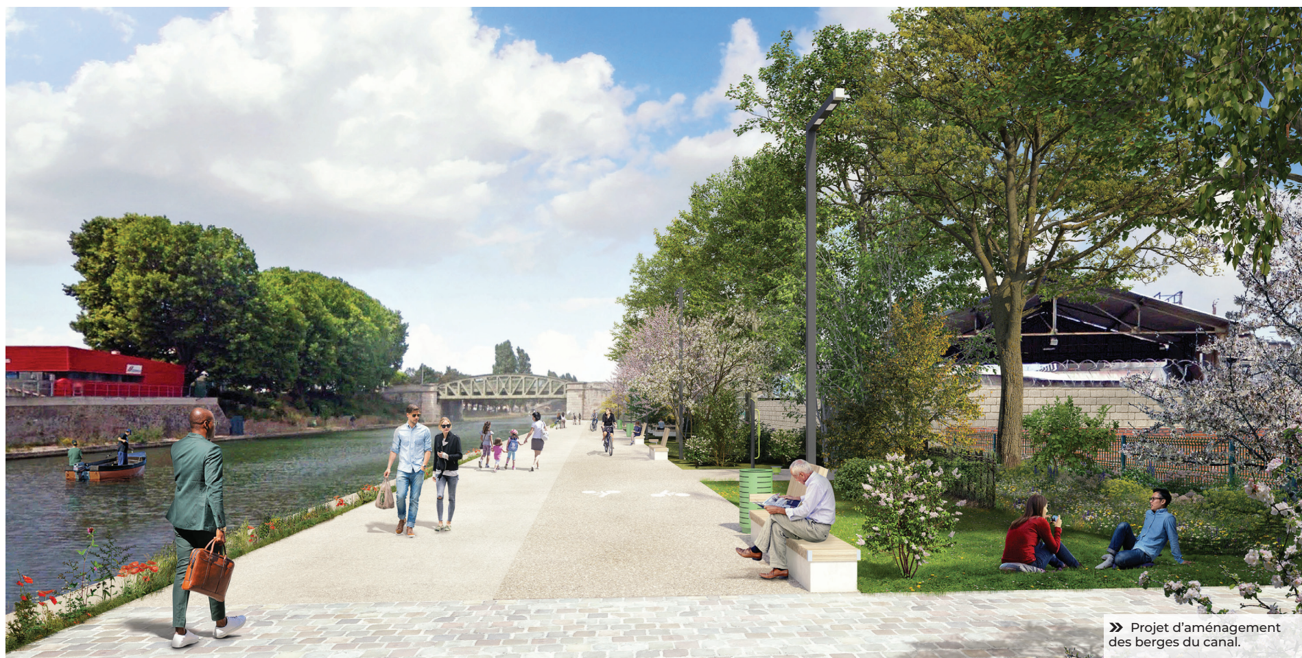
» Projet d'aménagement des berges du canal.