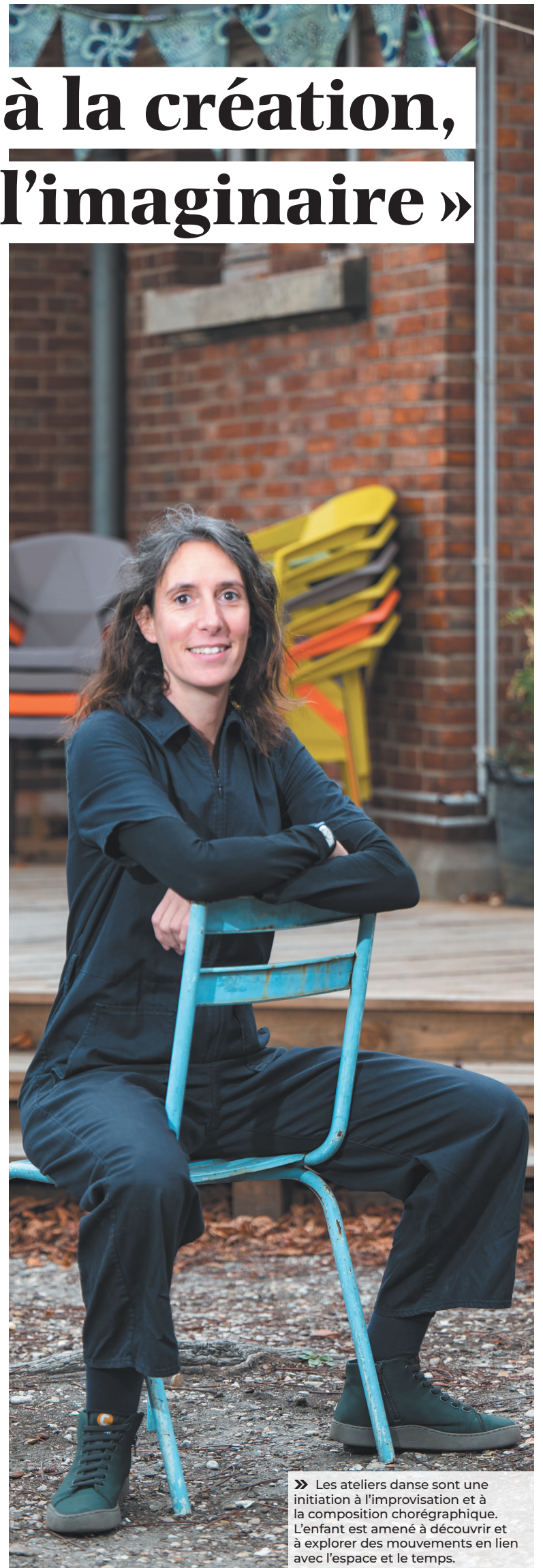
» Les ateliers danse sont une initiation à l'improvisation et à la composition chorégraphique. L'enfant est amené à découvrir et à explorer des mouvements en lien avec l'espace et le temps.

Ateliers de danse pour adultes, tous niveaux les mercredis de 19 h à 21 h à la salle Jacques Solomon au 4 rue Edgar Quinet www.encormele.com encormele.contact@gmail.com