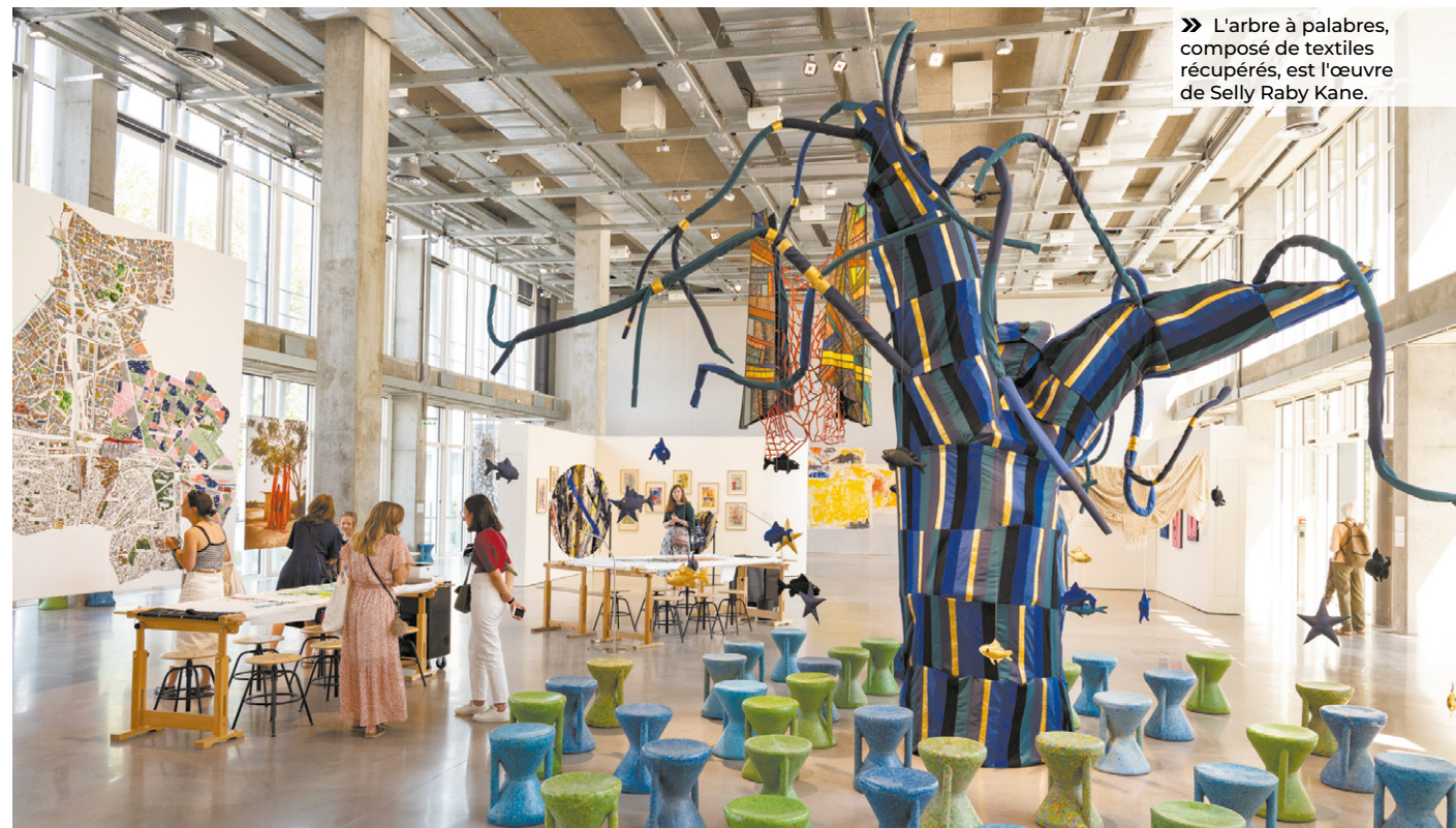
» L'arbre à palabres, composé de textiles récupérés, est l'œuvre de Selly Raby Kane.

Pour retrouver toute la programmation : https://www.le19m.com/sur-le-fil-dakar-paris