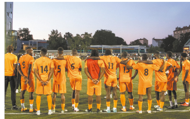
» 2 e édition d'Auber Nation Cup Le stade André-Karman était plein à craquer samedi 24 juin pour assister à la finale de la deuxième édition de la Coupe des nations de football organisée par la Mission locale, l'Omja et un collectif d'associations comme AuberMédiation ou À travers la ville. La Côte d'Ivoire a remporté le tournoi face à l'Algérie.