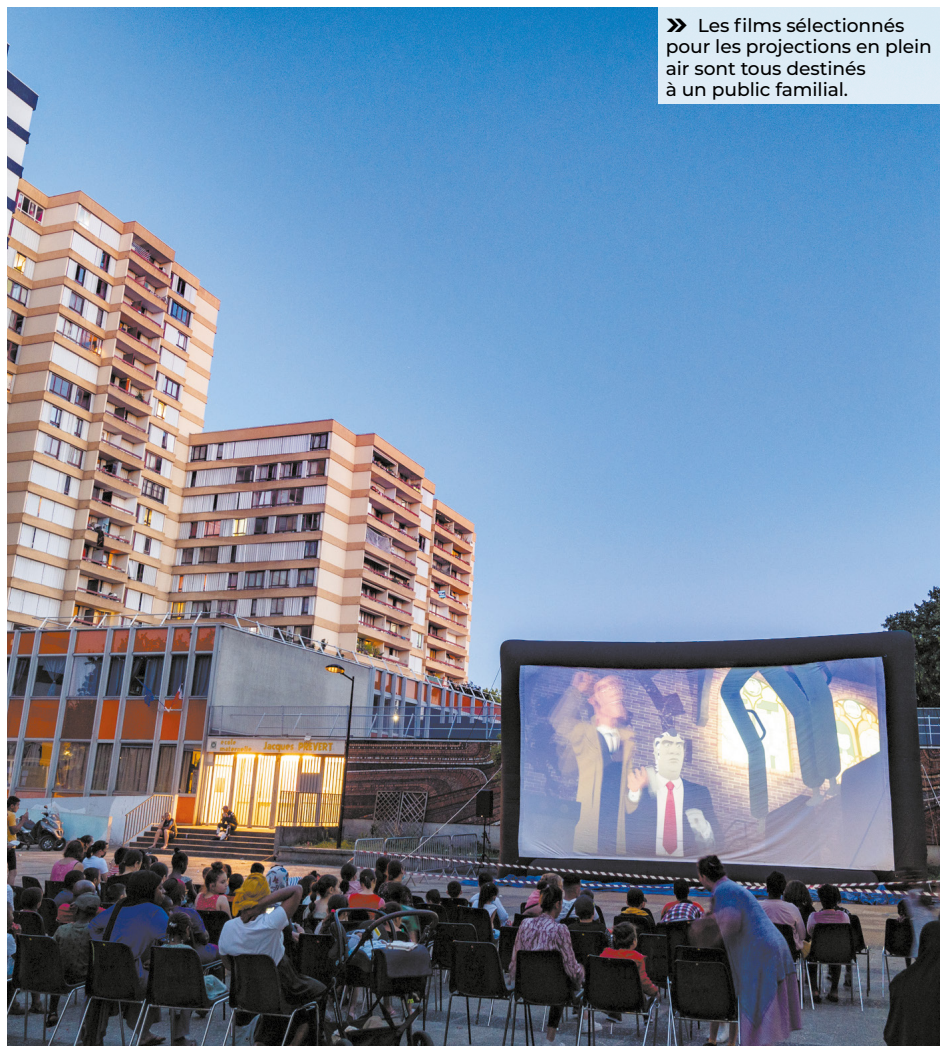
» Les films sélectionnés pour les projections en plein air sont tous destinés à un public familial.

aux Sports. D'autres activités spécifiques en dehors de la ville sont proposées à la journée uniquement, moyennant parfois une participation financière de quelques euros : baignade, rafting, surf, stand up paddle, kayak, piscine à vagues, équitation, vélo, Koezio (parc d'aventures avec jeux géants, labyrinthe, accrobranche indoor, escape game), sortie à la mer, etc. Retrouvez le programme complet, jour par jour, sur le site internet de la Ville.