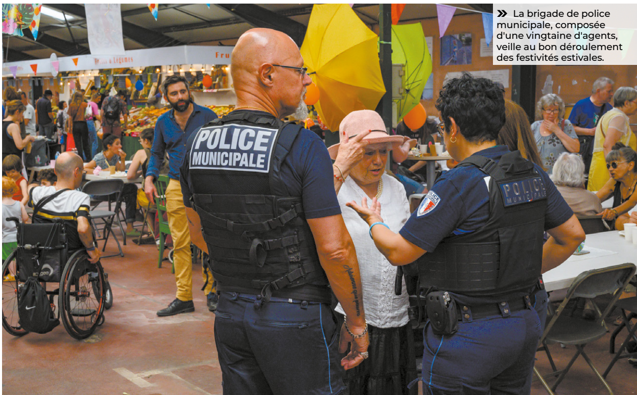
» La brigade de police municipale, composée d'une vingtaine d'agents, veille au bon déroulement des festivités estivales.