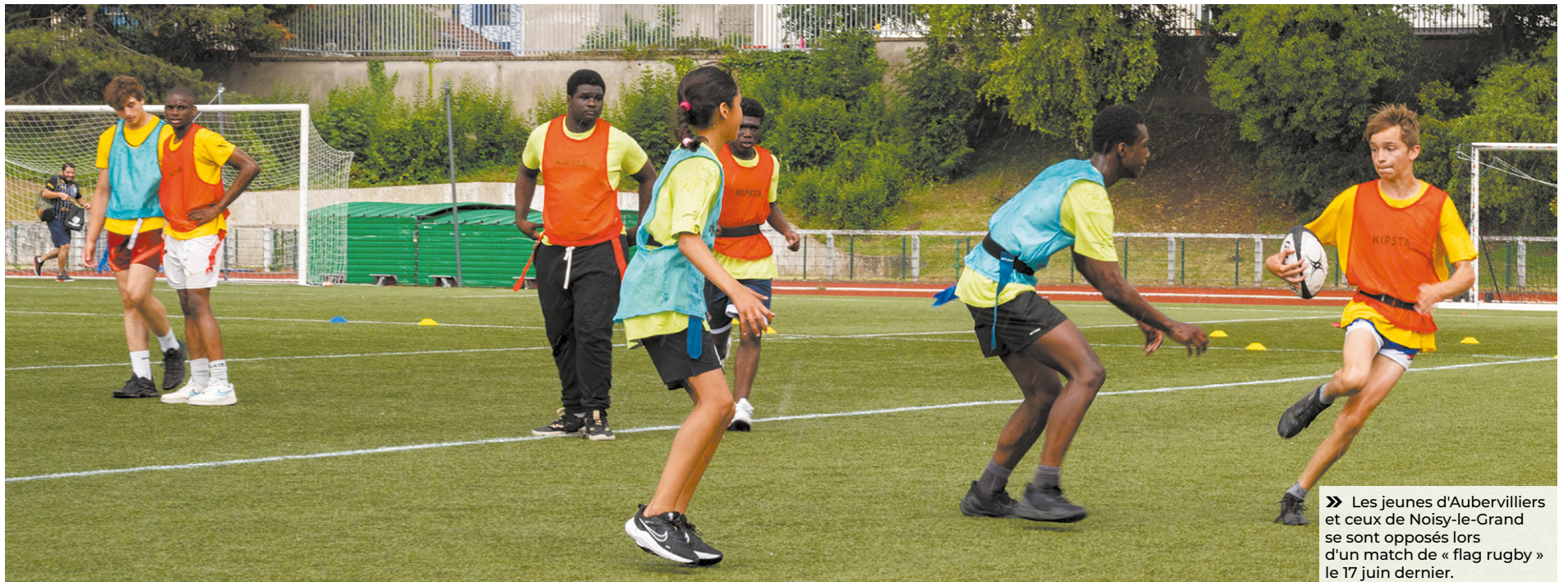
» Les jeunes d'Aubervilliers et ceux de Noisy-le-Grand se sont opposés lors d'un match de « flag rugby » le 17 juin dernier.

Les 11 et 12 juillet prochains, la direction de la Sécurité et de la Prévention inaugure les Olympiades des centres de loisirs d'Aubervilliers sur la base de loisirs d'Asnières-sur-Oise .