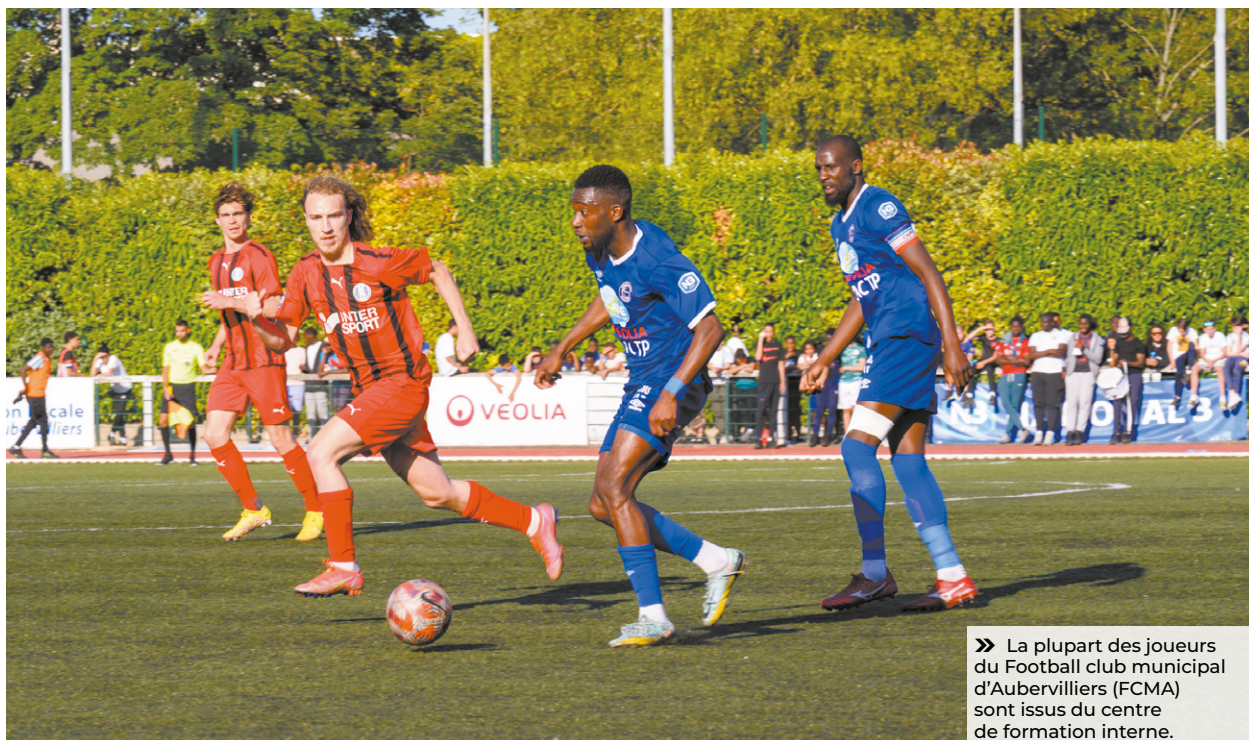
» La plupart des joueurs du Football club municipal d'Aubervilliers (FCMA) sont issus du centre de formation interne.