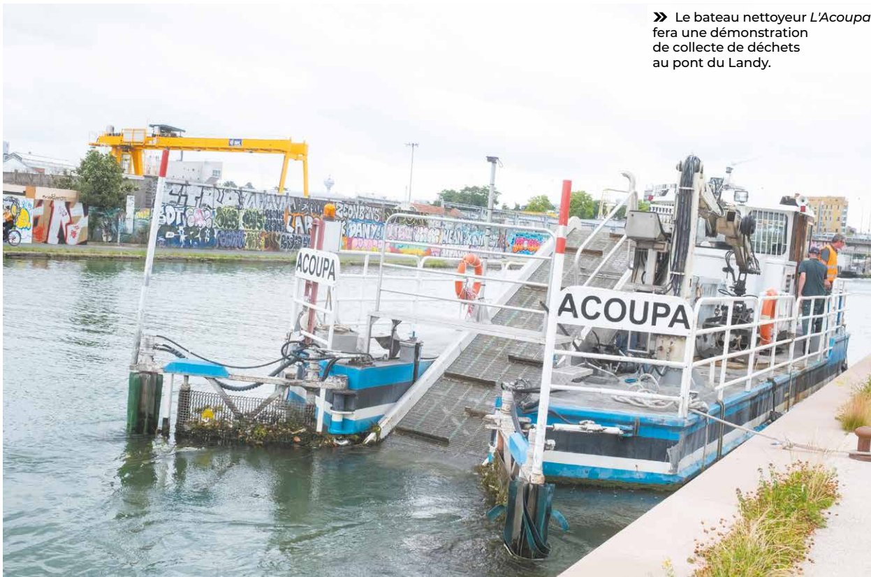
» Le bateau nettoyeur L'Acoupa fera une démonstration de collecte de déchets au pont du Landy.

Ces espaces publics en devenir méritent que les habitants se les approprient et en prennent soin, notamment autour de la question des déchets. C'est tout le sens des rendez-vous du 24 juin. Trois temps forts sont prévus à Aubervilliers. Tout d'abord, à 14 heures, au pont du Landy, le bateau nettoyeur des canaux parisiens fera une halte. Son nom ? L'Acoupa , du nom d'un poisson tropical guyanais vorace. Les visiteurs, petits et grands, pourront tout découvrir de son quotidien. Long de 12 mètres, il collecte les déchets flottants (canettes, bouteilles, sacs plastiques...) grâce à deux bras rabatteurs mais peut aussi, grâce à sa grue, remonter les objets lourds qui sont