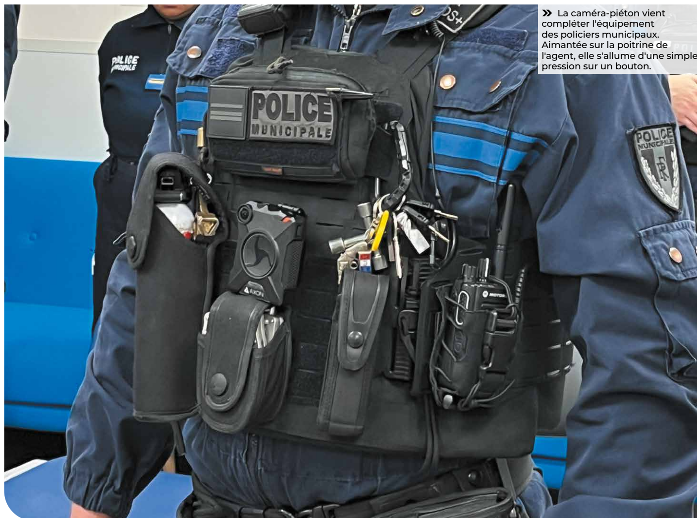
» La caméra-piéton vient compléter l'équipement des policiers municipaux. Aimantée sur la poitrine de l'agent, elle s'allume d'une simple pression sur un bouton.