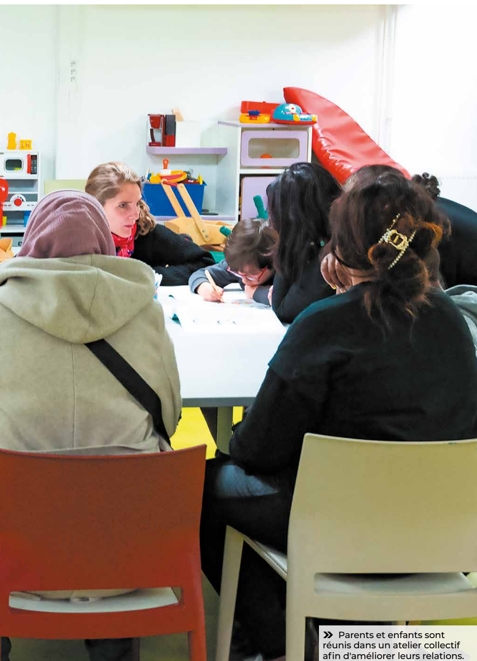
» Parents et enfants sont réunis dans un atelier collectif afin d'améliorer leurs relations.