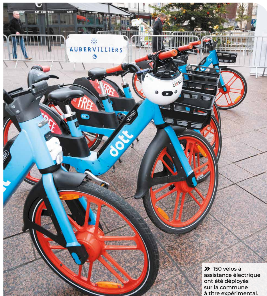
» 150 vélos à assistance électrique ont été déployés sur la commune à titre expérimental.

Dott se donne pour mission principale de rendre la mobilité douce accessible à tous. Cette préoccupation correspond aux ambitions de la Municipalité en matière de