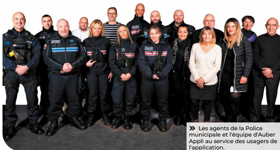
» Les agents de la Police municipale et l'équipe d'Auber Appli au service des usagers de l'application.

105 signalements transférés (le signalement concerne un problème qui n'entre pas dans les missions de la PM)