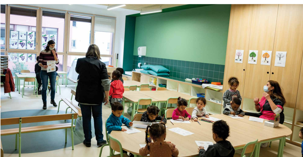
» Visite de la nouvelle école primaire, Malala-Yousafzai, 40 rue Gaëtan-Lamy Karine Francllet, Maire d'Aubervilliers, l'Inspectrice de l'Éducation nationale et des élus ont visité, le 9 novembre, ce nouveau groupe scolaire qui dispose, en plus des 10 classes élémentaires et des 6 classes maternelles, de centres de loisirs maternel et élémentaire, de deux salles de motricité de 200 m 2 mutualisables avec les activités périscolaires et de deux cours de récréation végétalisés (lire p.11).