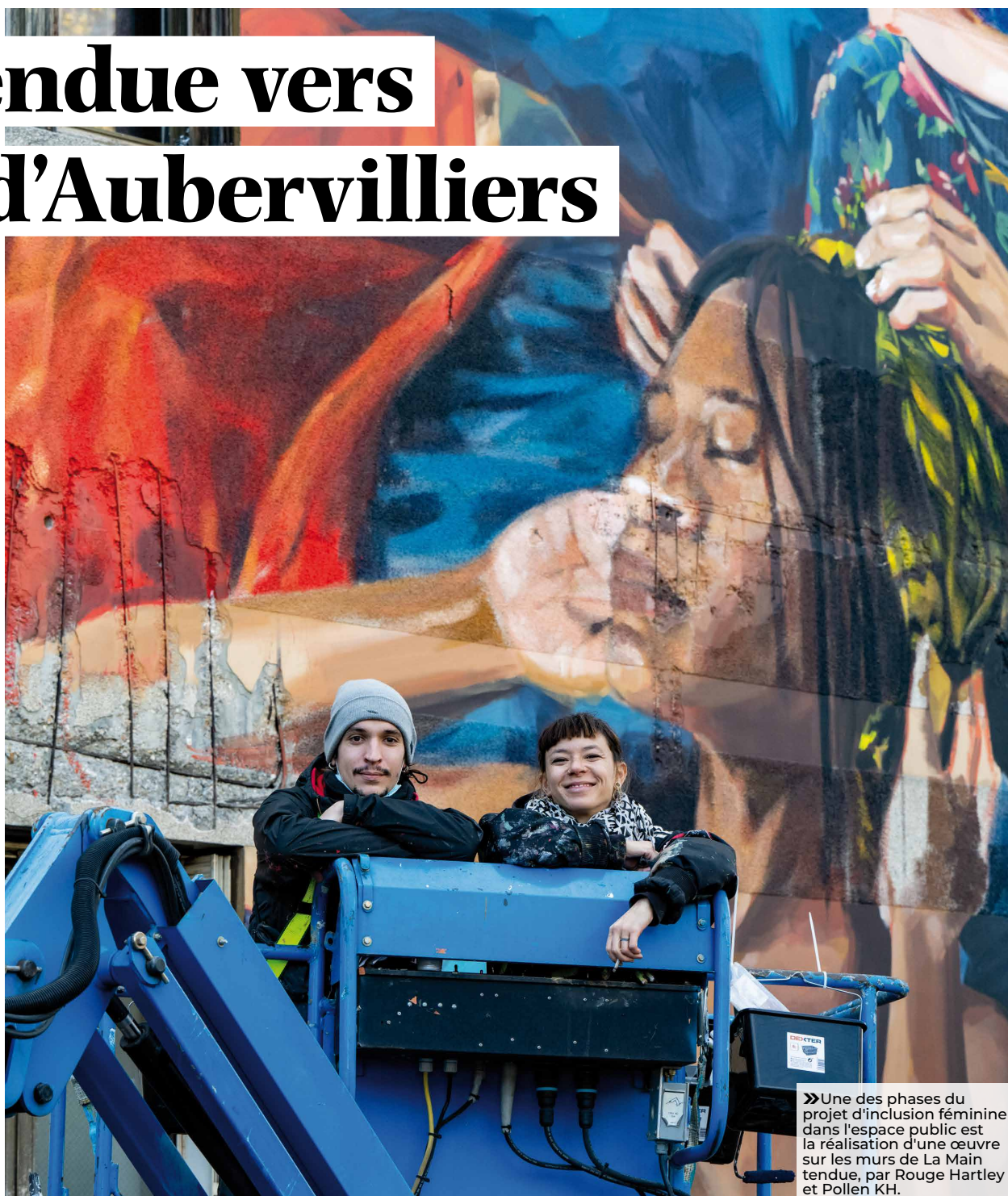
» Une des phases du projet d'inclusion féminine dans l'espace public est la réalisation d'une œuvre sur les murs de La Main tendue, par Rouge Hartley et Pollen KH.

En 1978, l'association s'installe dans ses nouveaux locaux, au 10, rue des Cités, qui permettent d'accueillir et d'offrir un hébergement à des femmes en difficulté dans un cadre plus chaleureux et convivial. En mars 1990, elle signe une convention au titre de centre d'hébergement et de réinsertion sociale (CHRS). « Depuis plusieurs années, l'association s'agrandit et a plusieurs centres d'hébergement sur Aubervilliers et sur le département. En 2011, La Main tendue s'est associée à l'association l'Hôtel Social 93 pour