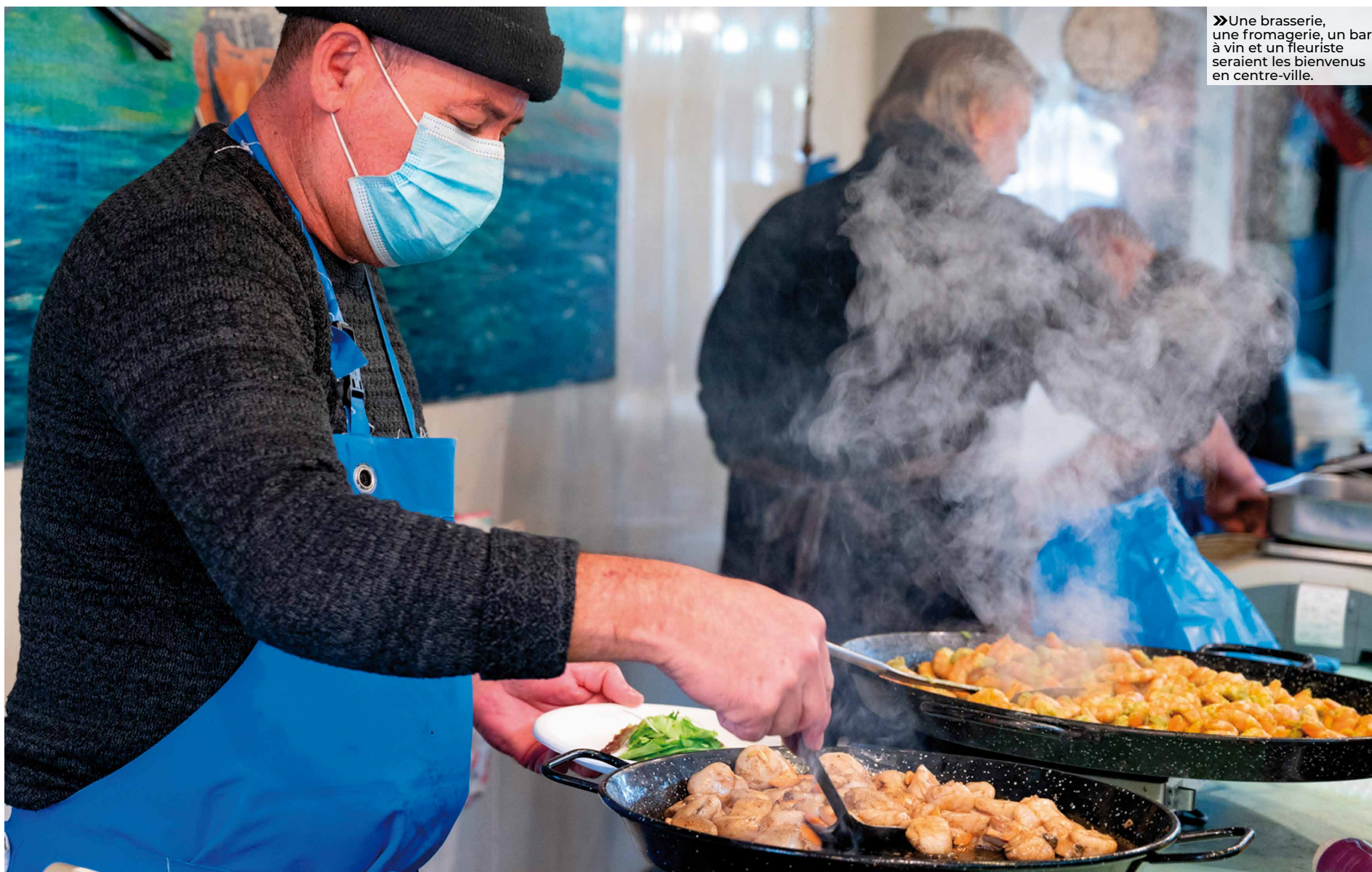
» Une brasserie, une fromagerie, un bar à vin et un fleuriste seraient les bienvenus en centre-ville.