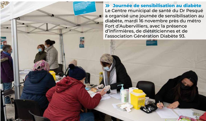
» Journée de sensibilisation au diabète Le Centre municipal de santé du Dr Pesqué a organisé une journée de sensibilisation au diabète, mardi 16 novembre près du métro Fort d'Aubervilliers, avec la présence d'infirmières, de diététiciennes et de l'association Génération Diabète 93.