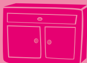
LES MEUBLES DIVERS USAGÉS