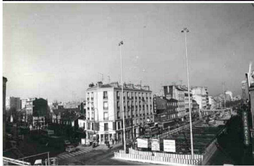
En haut, la route de Flandre fin XIX e , alors surnommée péjorativement « La Petite Prusse » en rapport avec les nombreux immigrés venus y travailler. En bas, la même route pavée, en cours d'aménagement, deuxième moitié du XX e siècle.

d'Alsace-Lorraine, rejoignirent la région parisienne dont des artisans verriers qui détenaient les secrets de couleurs du verre. Ils contribuèrent à l'expansion de nombreuses manufactures.