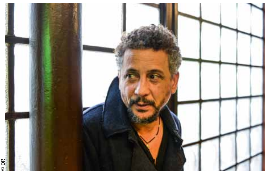
Après trente ans de carrière, l'acteur n'a pas oublié d'où il vient.